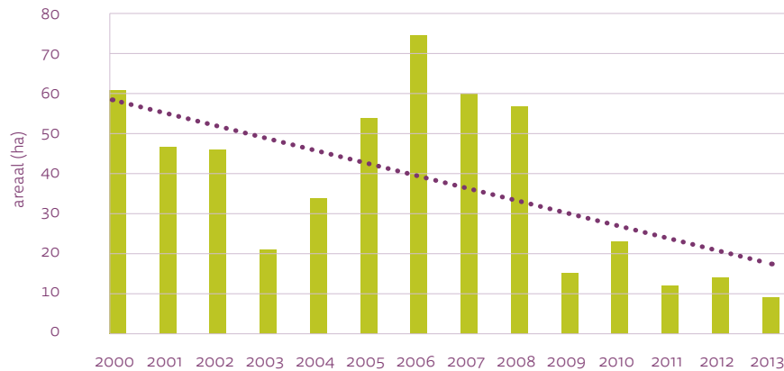
Figuur 2.1 Uitgifte bedrijventerreinen in de provincie Drenthe in de periode 2000–2013. De uitgifte in 2014 was medio 2015 nog niet bekend.

De inzet van de provincie is dat in twee samenwerkingsregio's, namelijk Groningen-Assen en Drentse Zuidas, gemeenten zelf het initiatief nemen om met enige regelmaat vraag en aanbod van nieuw bedrijventerrein opnieuw af te stemmen om overaanbod te voorkomen. De provincie biedt, indien gewenst, hierbij ondersteuning. Dit houdt in dat de provincie in feite geen uitvoering heeft gegeven aan aanbeveling 1 van de Rekenkamer, namelijk om richting gemeenten bij het ontwikkelen en in gebruik nemen van nieuw bedrijventerrein meer directief te sturen. De Rekenkamer merkt op dat de provincie niet alleen een rol vervult als regisseur voor de ruimtelijke ordening, maar ook toezichthouder is op de gemeentefinanciën. Uit een landelijke evaluatie van gemeentelijke grondbedrijven blijkt dat gemeenten naar verwachting de komende jaren nog fors moeten afboeken op aangekochte terreinen voor nieuwe woningen en bedrijven doordat er nog steeds sprake is van aanzienlijk overaanbod. 12