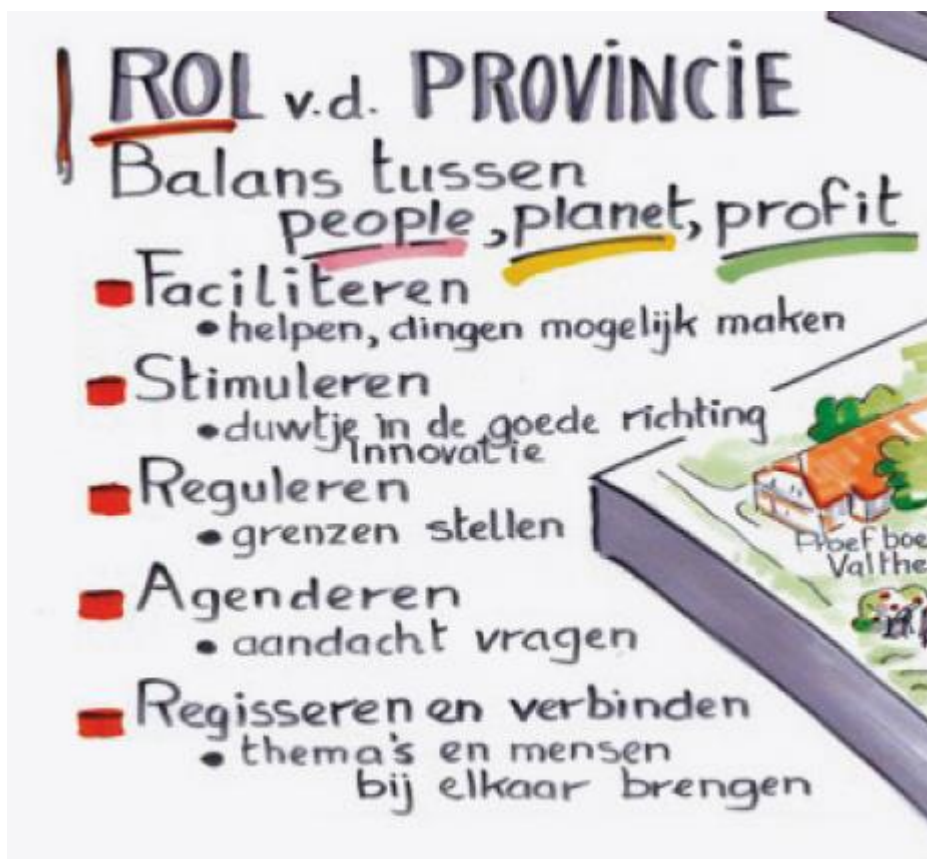
Figuur 1: verschillende rollen die de provincie voor zichzelf ziet